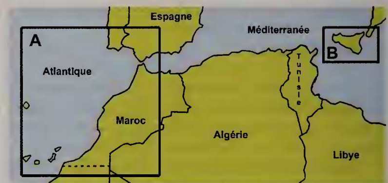
Figure 3 A-B. Aire de distribution européenne de Pseudosimnia juanjosensii . A. Population de l'Atlantique. B. Population de la Méditerranée centrale.

Cette récolte de Pseudosimnia juanjosensii constitue le second rapport documenté attestant la présence d'un spécimen vivant en Méditerranée (Fig. 3B). Combiné au premier rapport de Micali et al. (2013) et aux mentions sporadiques rapportées ci-dessus, elle permet de confirmer l'implantation de cette espèce, précédemment répertoriée dans l'Atlantique ouest-africain (Iles Canaries et Maroc) et sud-ouest européen (monts sous-marins au large du Portugal) (Fig. 3A), sur les côtes de la Sicile. Les deux populations actuellement recensées sont relativement éloignées l'une de l'autre. L'espèce est donc à rechercher en Méditerranée occidentale dans les milieux à gorgones d'eaux profondes pour combler l'hiatus existant à ce jour entre la population atlantique et celle de Méditerranée centrale (Fig. 3).